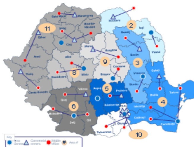
Harta retea corporate la 31.12.2014