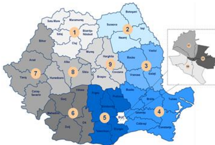
Harta retea retail la 31.12.2014